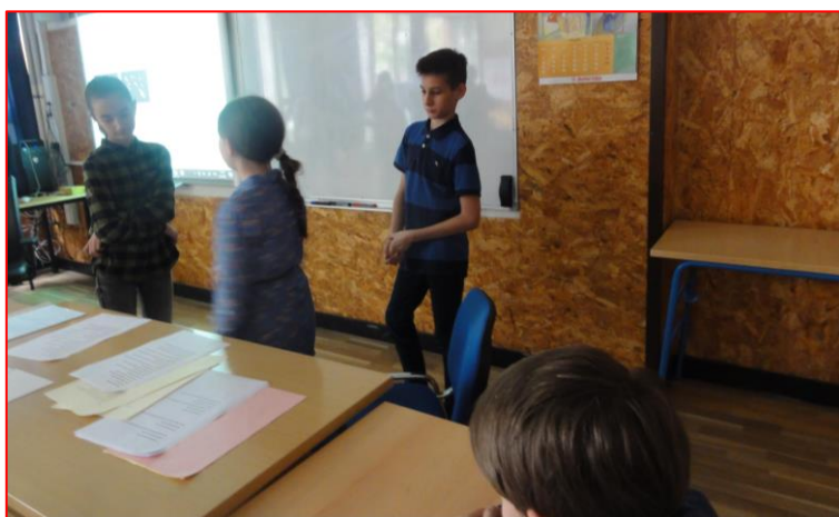
(Erasmus +) Multlingva Akcelilo.

Temas pri realigo de projekto kiu forĵetis plurajn antaŭjuĝojn de esperantistoj mem: ke ni devas havi esperantistajn instruistojn (aŭ fakultate diplomitajn E-instruistojn kiujn kreas iu porinstruista universitato, aŭ profesiajn instruistojn de fremdlingvoj kiuj havas ankaŭ grandan scion de Esperanto (ekzamenon C-1), aŭ ke Esperanton povas lerni nur tiuj kiuj tion vere ŝatas kaj deziras – kiuj ĝin lernas pro la propra rekono de graveco de Esperanto. Sed ĉi tie lernis ĝin instruistinoj pro lerneja devigo kaj lernantoj ĉar oni petis ilin. Neniu el ili iam ajn eĉ aŭdis pri Esperanto. Kaj vidu, tre bonaj didaktikaĵoj ebligis ke ili ĉiuj ekŝatis Esperanton kaj ne nur lernis la planitan programon unujaran, sed volas daŭrigi. Kaj gelernantoj kaj la gepatroj! Post ĉi tiu renkontiĝo, ĉio estos alia. Ni havos rimedon enkoduki E-on kun la komenca celo pli sukcese lerni poste aliajn fremdlingvojn kaj la propran, sed poste daŭrigante lerni ĝin nur pro Esperanto mem. Ni ne bezonas aparte edukitajn E-instruistojn. Tion povas fari iu ajn fremdlingva instruisto.