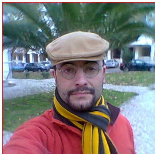
Lisbono, 2016 aŭ 2017.

La menciita retpaĝaro, vizitebla en la propra retnomo esperanto.pt, estas kulise refasonata kaj tial prezentas dume ties staton de 2007 senŝanĝe, malkrom unu aktualigata startpaĝo. Krome, Portugala Esperanto-Asocio eldonas esperantlingvan bultenon ( Nia Bulteno ) kiu, kompanse al diversaj internaciaj laŭdoj pri redaktkvalito, havas tre malregulan kaj averaĝe maloftan aperitmon.